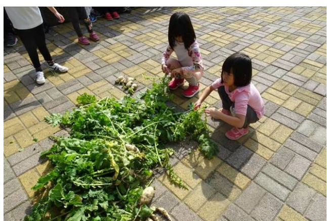
剪掉不要枝葉，拿回家煮