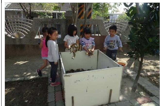
把落葉放入堆肥區