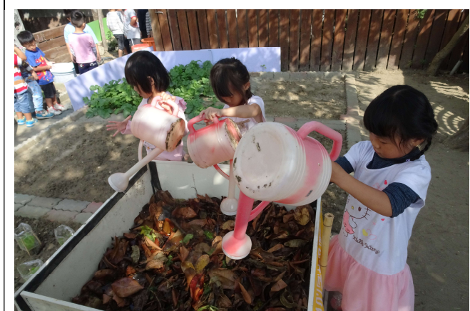
加水幫助堆肥發酵