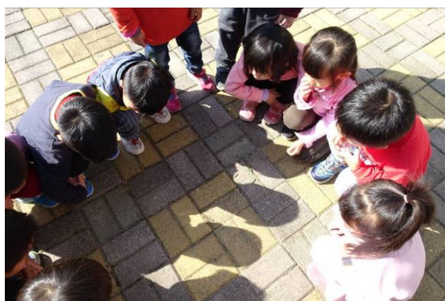
抓了好多菜蟲，大家一起來觀察