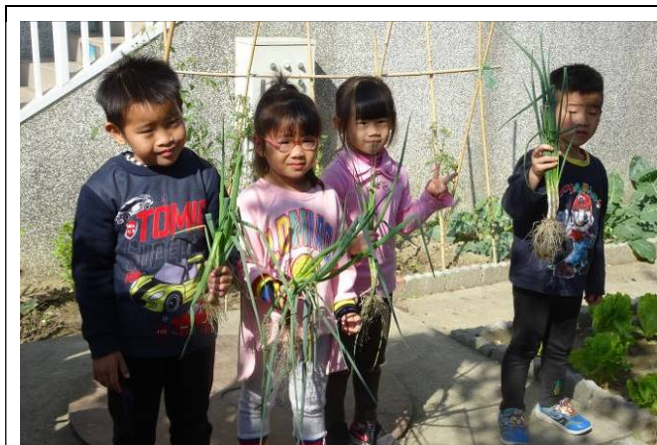
菜都長大了，可以收成了