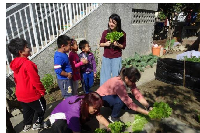
請老師一起來收成