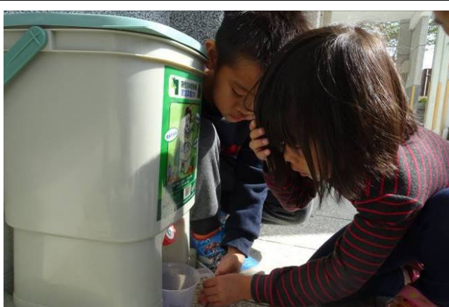
收集液肥來為菜苗施肥