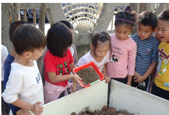
把泥土混入堆肥區