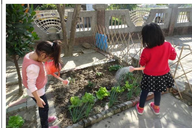
給蔬菜營養的液肥