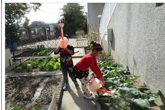
拿稀釋過的液肥來施肥