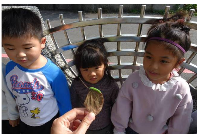
菜蟲好可怕，看看就好