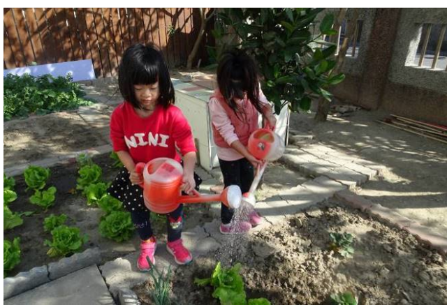
拿稀釋過的液肥來施肥