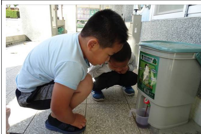
堆肥發酵後流出液肥