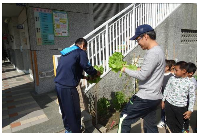
請老師一起來收成