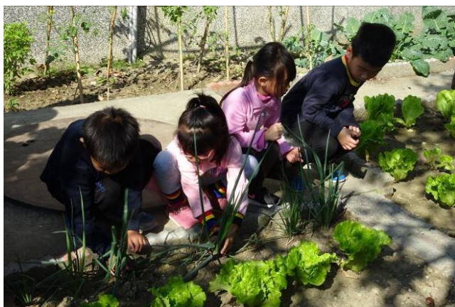
大家一起來抓菜蟲