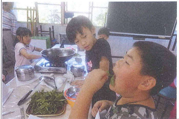
8. 一同品嚐辛苦採收和動手炸的茶葉，吃起來特別酥脆好吃喔！