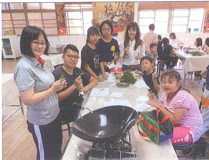
9. 茶食 DIY-炸茶葉