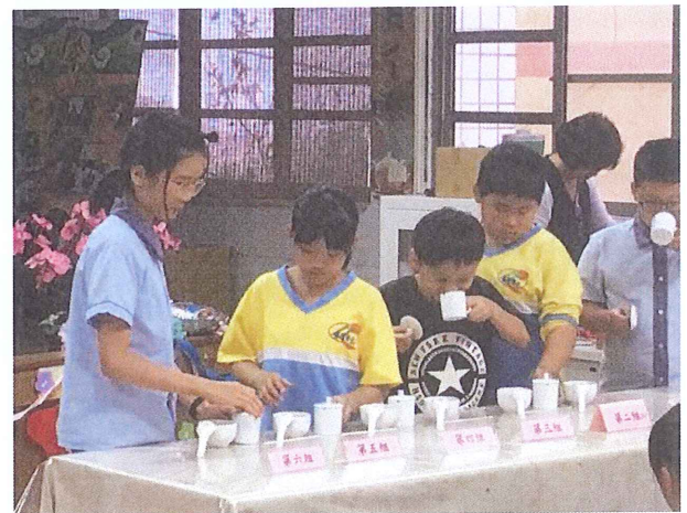
7. 看顏色、聞味道、品茶香，茶評鑑真不簡單