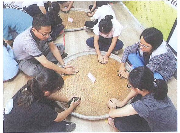
6. 將茶葉揉成條狀需要耐心及技巧學習