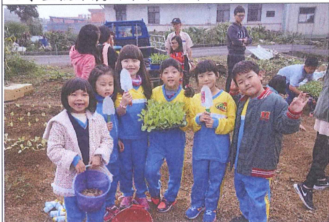
2. 老師帶領學生們撒種子及種菜苗