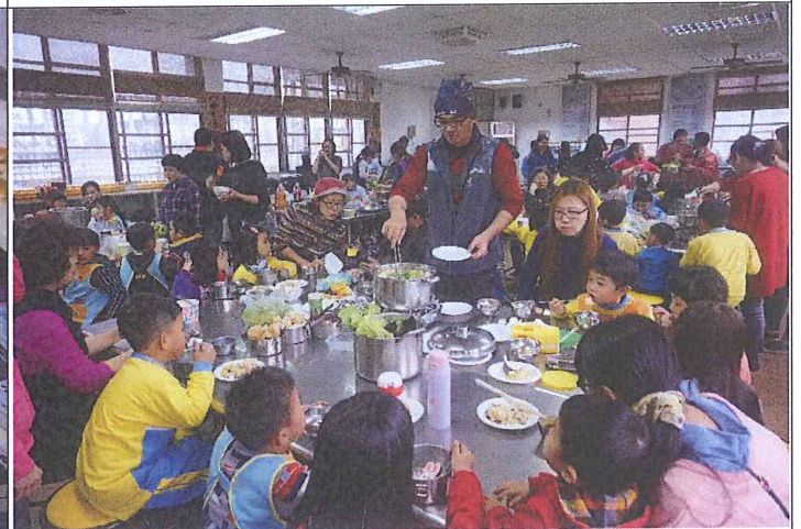
8. 邀請家長們一同品嚐辛苦培育的蔬菜，吃起來額外甘甜！