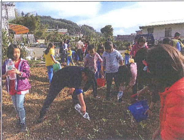
3. 學生準備種菜苗，並每周利用時間除草。