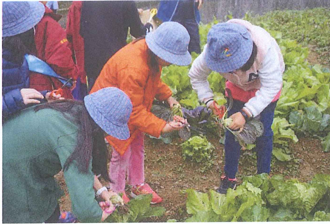
5. 開心拔菜，對學生而言是新奇的體驗！