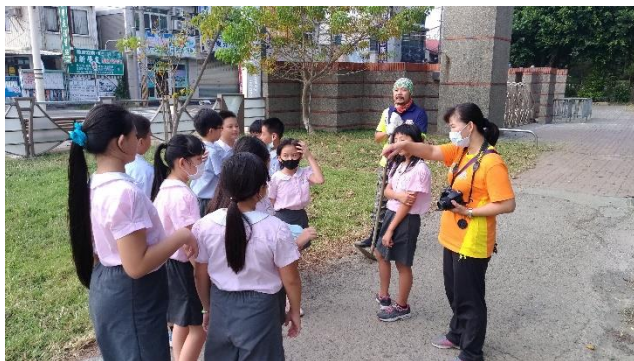
照片說明：鈞澤青農指導農事