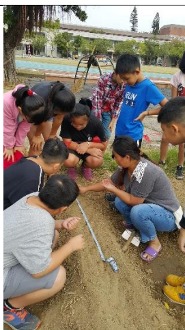
照片說明：家長投入指導