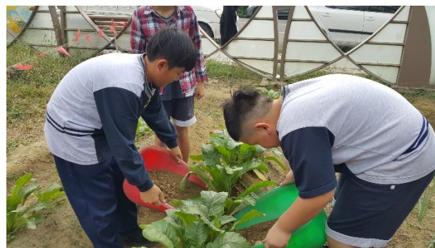
照片說明：辛勤澆水施肥