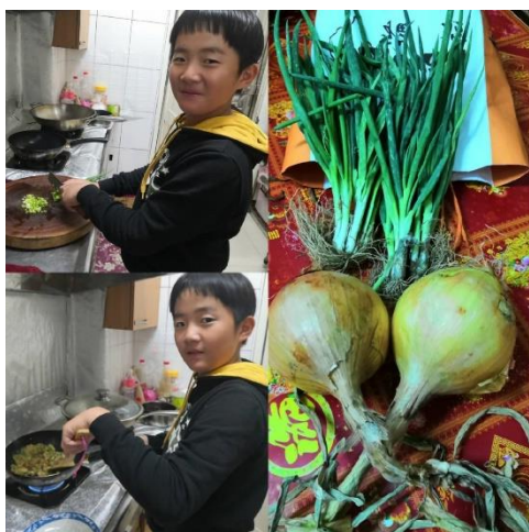
照片說明：家事協助下廚