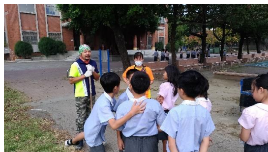
照片說明：鈞澤青農指導農事