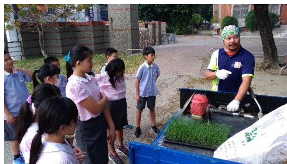
照片說明：鈞澤青農指導農事