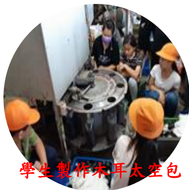
學生製作木耳太空包