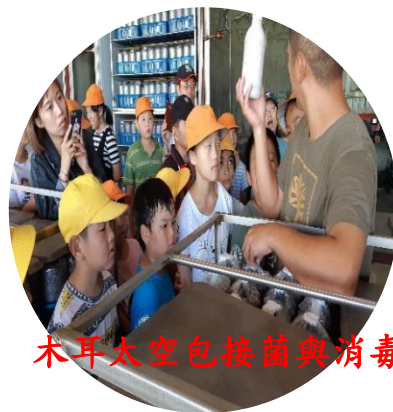
木耳太空包接菌與消毒