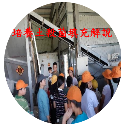
培養土殺菌填充解說